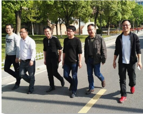
漫步无锡机电，感受校园文化