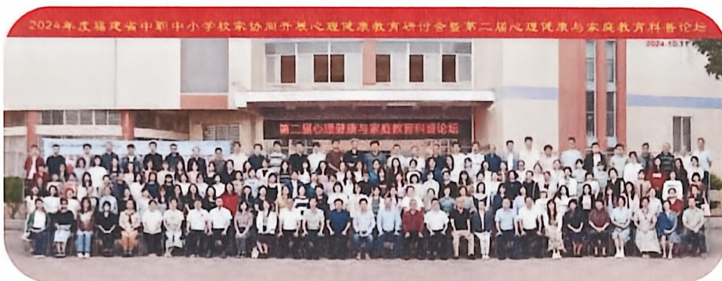
园艺心理.全省中职中小学校家协同心理健康教育研讨会