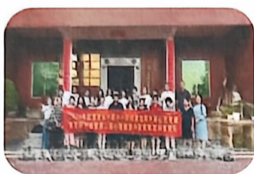
园艺心理.福建省心理健康与 家庭教育科普论坛