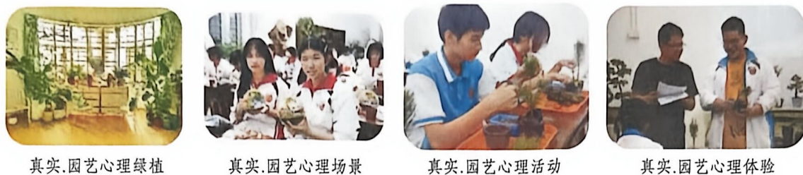
图 2.园艺心育的“四真”情境