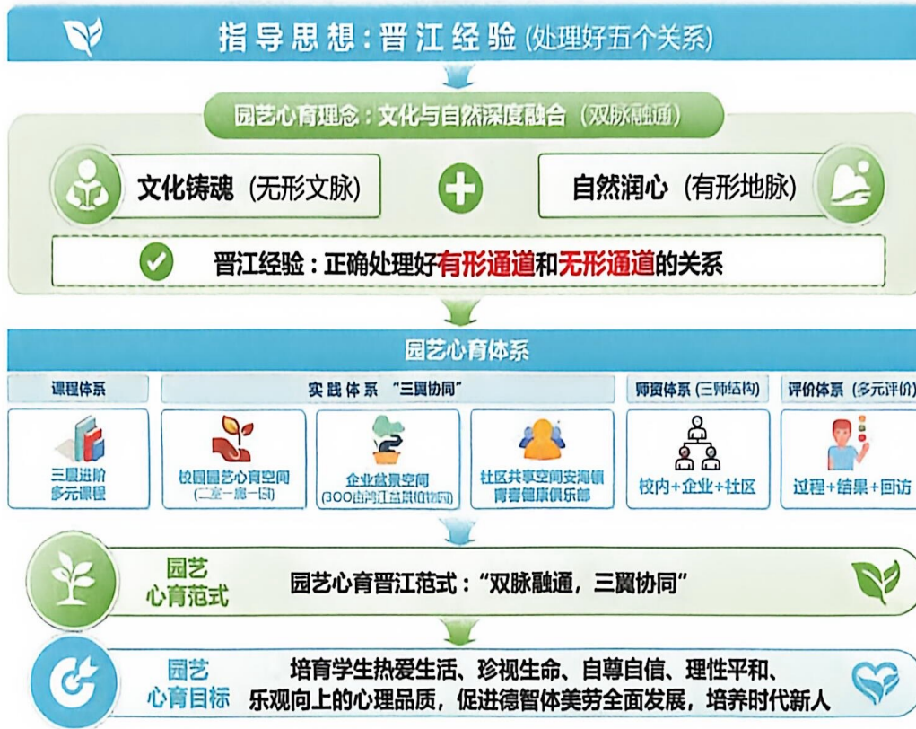
图 1.双脉融通·三翼协同的园艺心育“晋江范式”

共培、课程共建、阵地共享、危机共防的全域协同心育格局，全面提升了中职学生心理健康水平与综合素养。