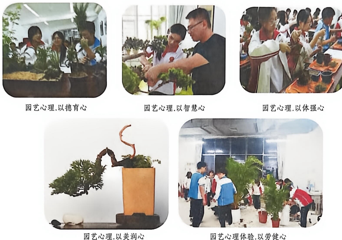
园艺心理.以德育心