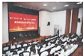
晋江市“城乡学校心理辅导室” 项目建设成果交流会